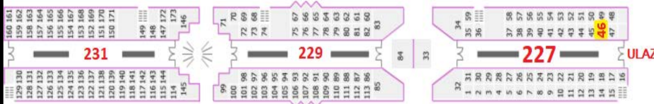
RASPORED LOKALA U PRIZEMLJU TRŽNI CENTAR ENJUB - ulaz u broj 227 je na pocetku TC iz pravca Delta sitija